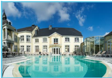
Château des Thermes - Charlier Christian