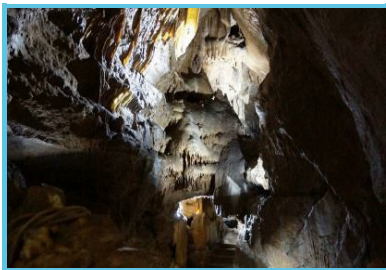
Les Grottes de Remouchamps