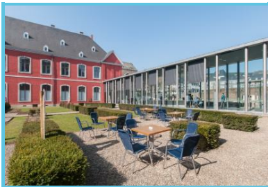
WBT - J.P. Remy