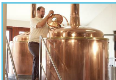
Brasserie des Fagnes