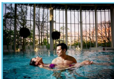
Thermes de Spa - Fabrice Debatty