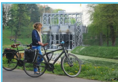
WBT - SPRL Cernix-Pierre Pauquay

Rue Tout-y-faut 90 Houdeng-goegnies - 7710