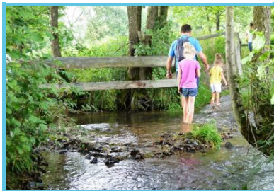
Ferme de la Planche