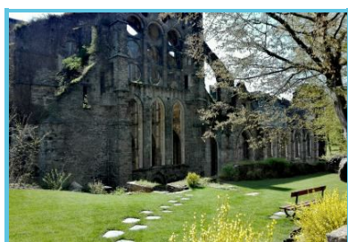
Abbaye de Villers asbl

Rue De L'abbaye 55 Villers-la-ville - 1495