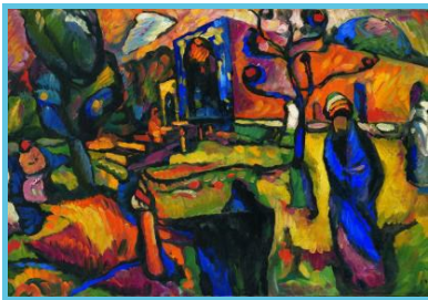
MUDIA - Vassily Kandinsky, Les arabes, 1909