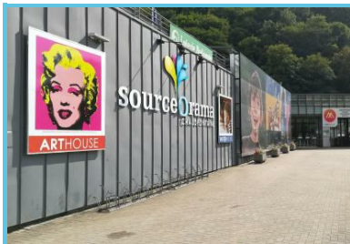
SourceOrama - Didier Gémis

Avenue Des Thermes 78b Chaudfontaine - 4050