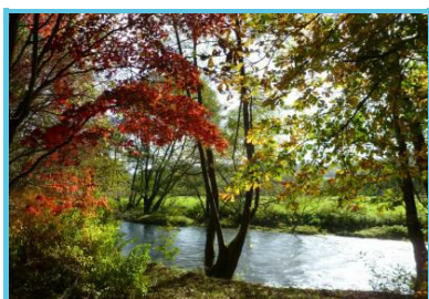
MT Ourthe et Aisne - C. Mottet-Rendeux