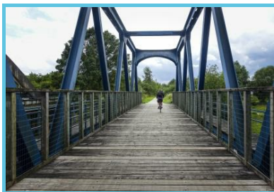
WBT – Hike Up/Railtrip.Travel