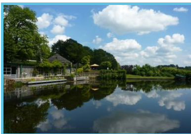
Lac de Bambois

Rue Du Grand Etang Fosses-la-ville - 5070