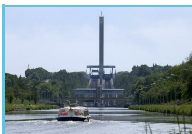
H.C.T - C.Carpentier