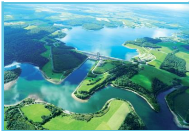
Les Lacs de l'Eau d'Heure