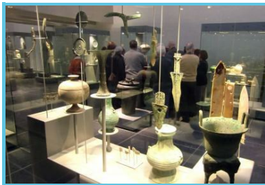
Musée royal de Mariemont

Chaussée De Mariemont 100 Morlanwez - 7140