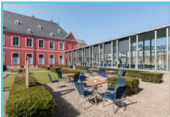
WBT - J.P. Remy