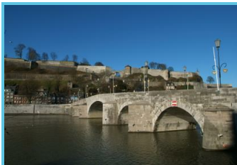
WBT - J.L. Flémal