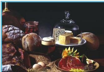
WBT - Avantage

Chaussée Brunehault 242 Estinnes-au-mont - 7120