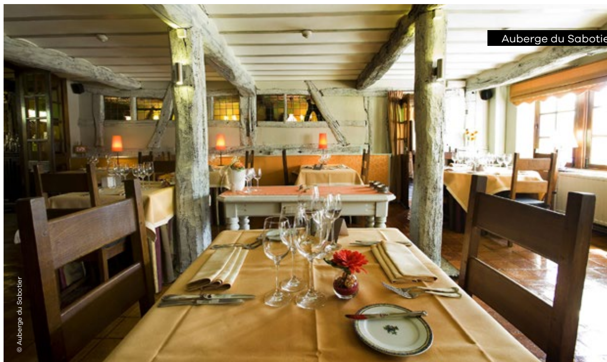
Auberge du Sabotier

Laneuville-au-Bois 36A • 6970 Laneuville-au-Bois lestrappeurs.be